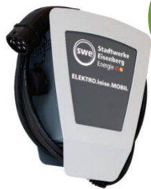
Heidelberger Wallbox Home Eco