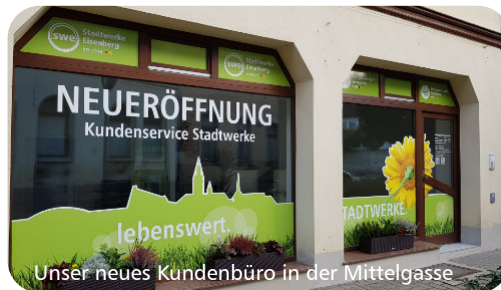
Unser neues Kundenbüro in der Mittelgasse