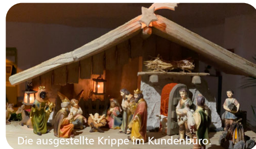
Die ausgestellte Krippe im Kundenbüro

An unserem neuen Standort beteiligen wir uns auch an der Aktion „Eisenberger Krippenweg 2020“. Wir stellen in unserem Schaufenster bis zum 10. Januar 2021 eine beleuchtete Weihnachtskrippe mit 11 Markusrippen-Figuren aus Polyresin (Kunstharz) aus. Damit ist sie eine von über 30 Krippen, die in den Schaufenstern am Markt, auf dem Steinweg und in der Friedrich-Ebert-Straße von den Besuchern bei einem gemütlichen Bummel durch die weihnachtlich geschmückte Innenstadt bestaunt werden kann.