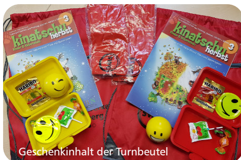
Geschenkinhalt der Turnbeutel