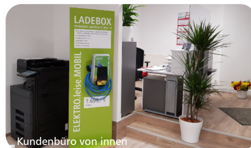
Kundenbüro von innen