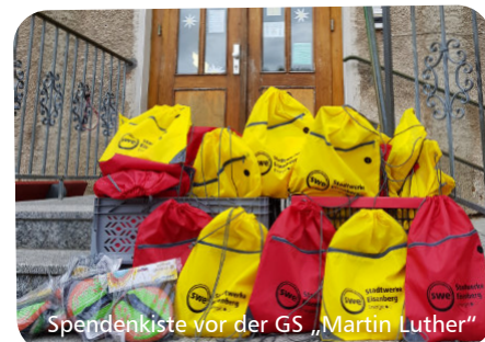
Spendenkiste vor der GS „Martin Luther“