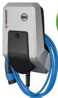
Mennekes Amtron Xtra 11 C2

steuerbar und förderfähig KfW 440 1.699 € inkl. 19 % USt